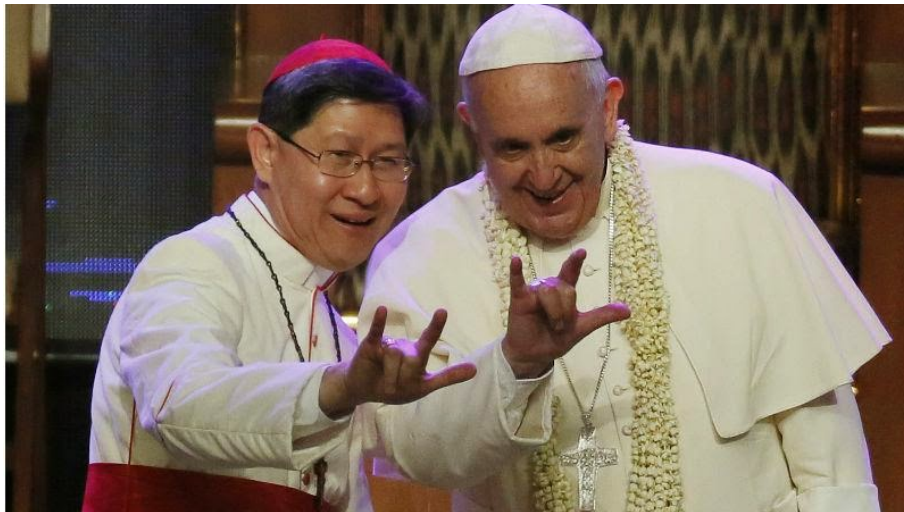
papeFrançois et le "Cardinal" Tagle faisant le geste satanique avec leurs mains lors de la "messe" finale à Manille.

Le très conciliaire site « Aleteia » s'en défend de cette manière :